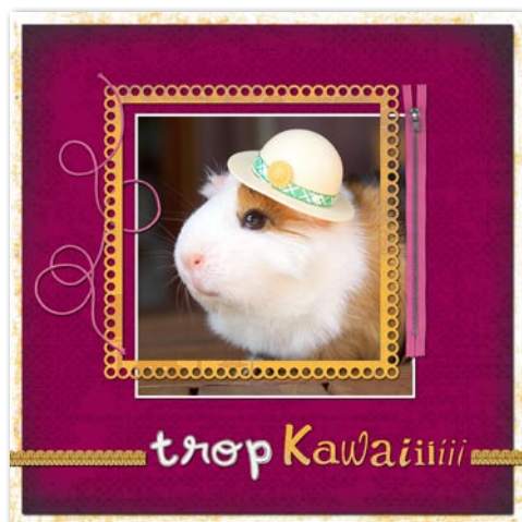
Page réalisée avec le kit « 100 % kawaii »

Face à l'engouement des utilisateurs pour Studio-Scrap, (le logiciel futé pour mettre en scène ses photos) le CDIP a mis au point depuis un an des kits pour Studio-Scrap.