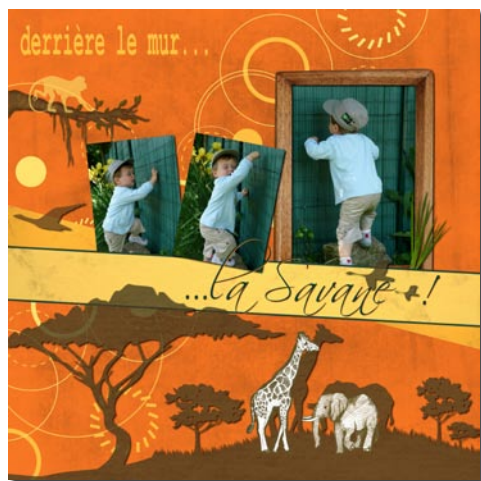
Page réalisée avec le kit « Terre de savane »

Cap vers le soleil de la savane africaine grâce aux dizaines de textures et d'embellissements du kit « Terre de savane » !