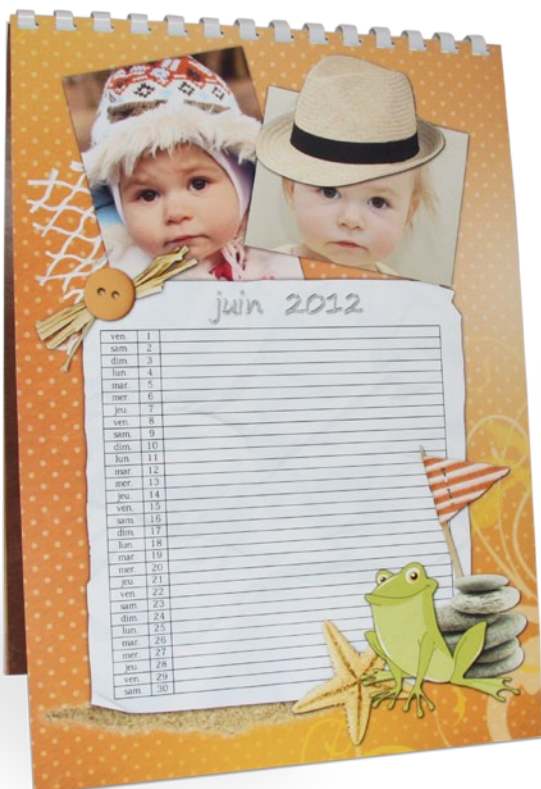
Un calendrier A4 portrait avec un espace pour les annotations à accrocher