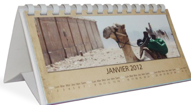
Un calendrier chevalet, idéal pour le bureau

Un calendrier à poser avec les fêtes à souhaiter !