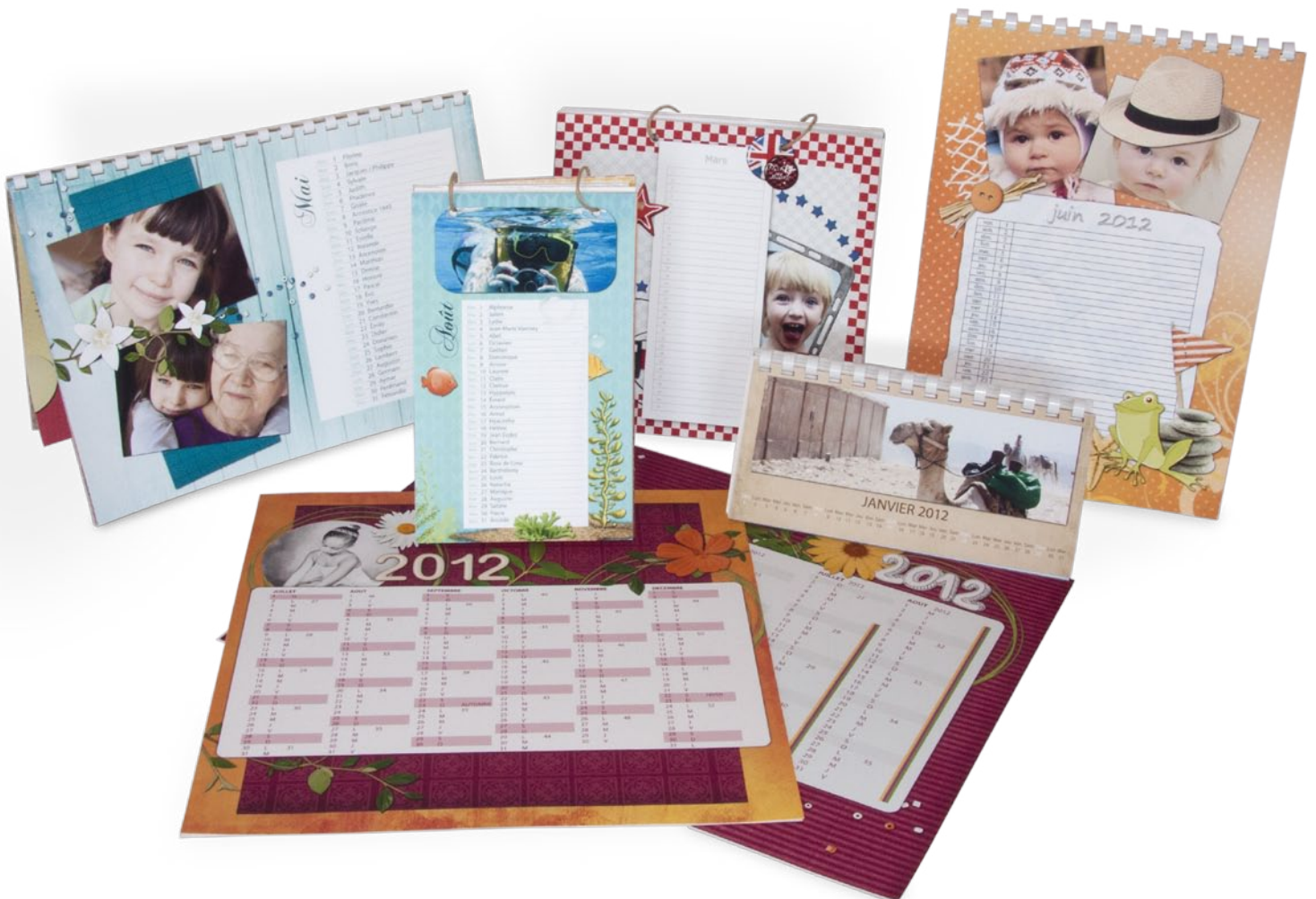
Vue d'ensemble de tous les calendriers !