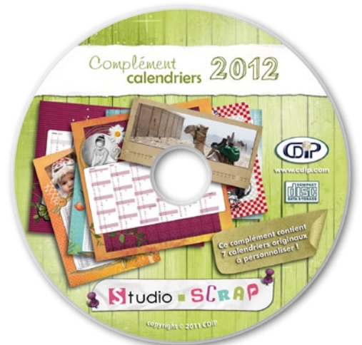
Cd-Rom du complément « Calendriers 2012 »

Reposant sur un système - simple et intuitif - de "glisser-déposer", ce nouveau disque additionnel permet à toute la famille de s'approprier, en quelques clics, l'un des 7 types de modèles personnalisables... Et ainsi d'exprimer toute leur créativité !