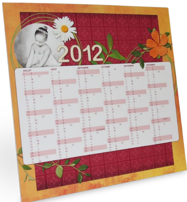
Un calendrier recto/verso semestriel (format 30 x 30 cm)