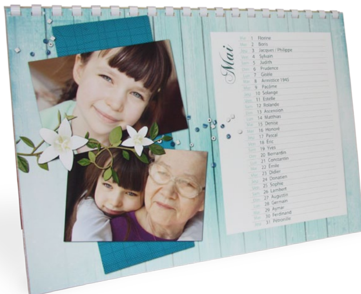
Un calendrier A4 en paysage dont une grande partie est attribuée aux photos