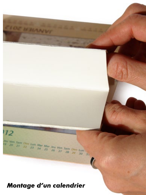
Montage d'un calendrier

Pour finir, on découpe, on plie, on colle et on assemble l'objet. Le tour est joué !