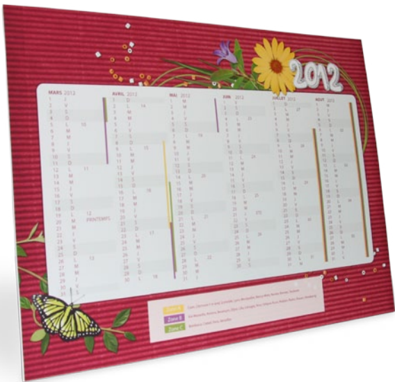
Un calendrier recto/verso avec les vacances scolaires (format 30 x 40 cm)