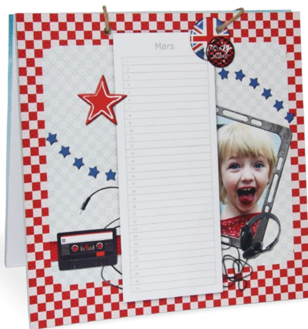
Un calendrier carré perpétuel pour indiquer les anniversaires